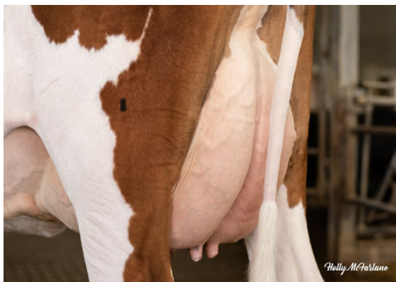
PROGENESIS GTEE CABERNET RED FOURTH DAM