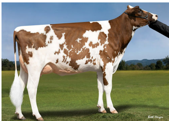
HOLLENDAL JEDI CRIM-RED FIFTH DAM